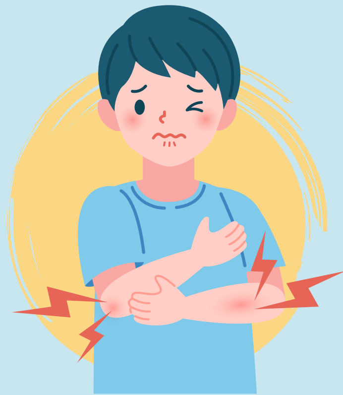
Dolor, hinchazón y enrojecimiento en donde se aplicó la inyección