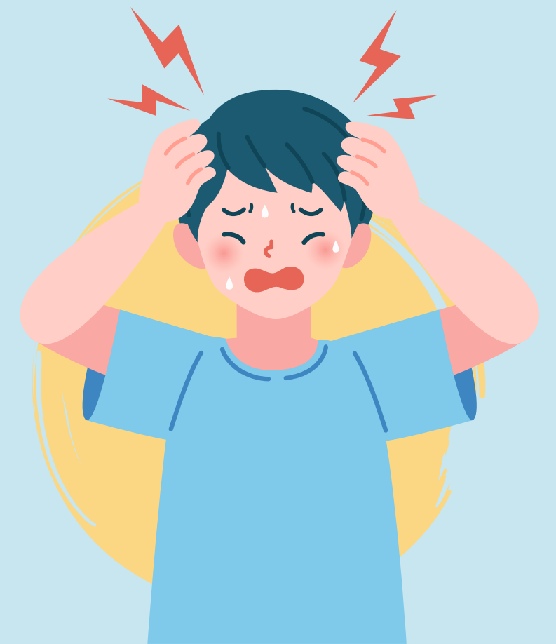
Dolor de cabeza