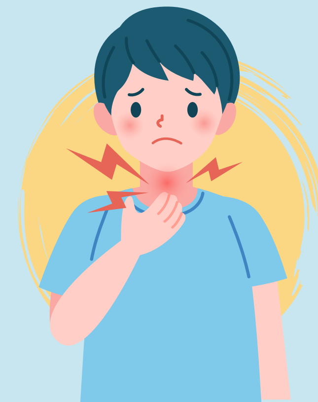
Ganglios linfáticos inflamados