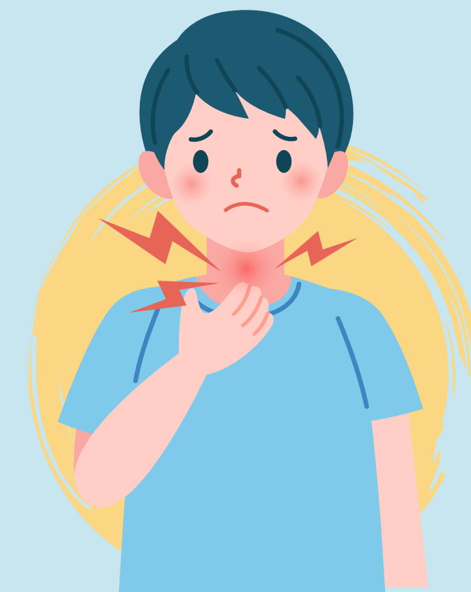
Ganglios linfáticos inflamados