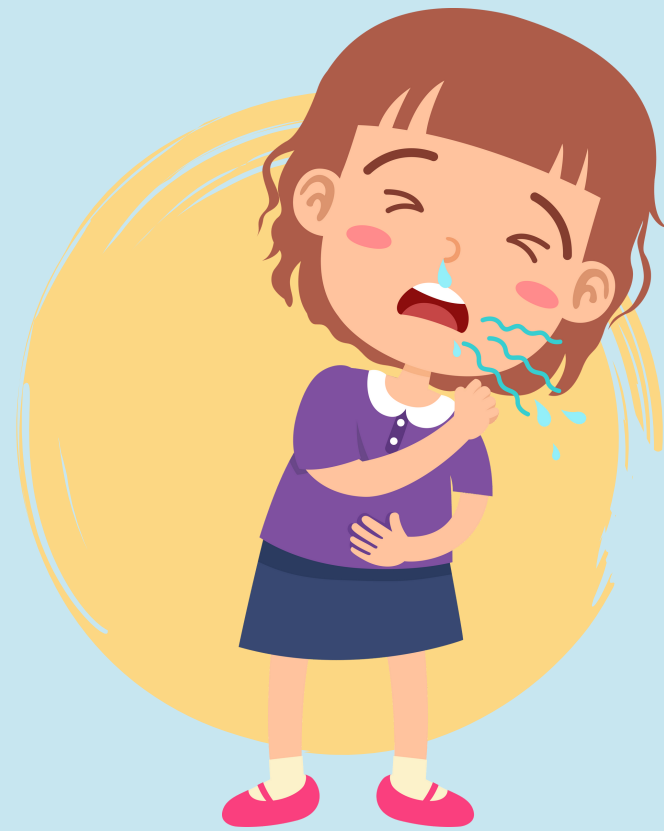
Dolor en el lugar en donde se aplicó la vacuna