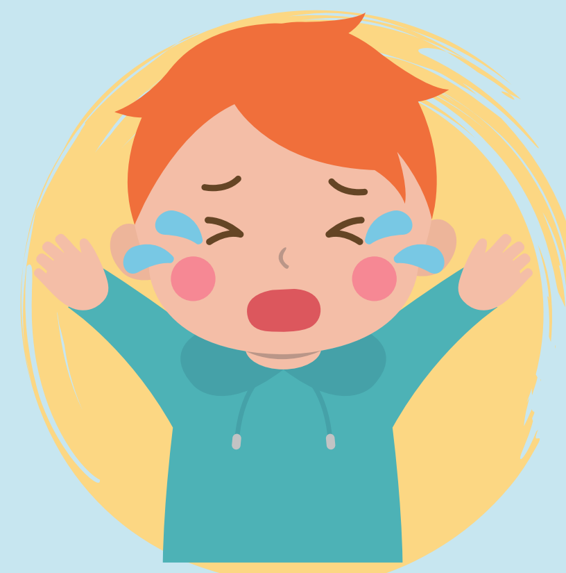
Irritabilidad o llanto