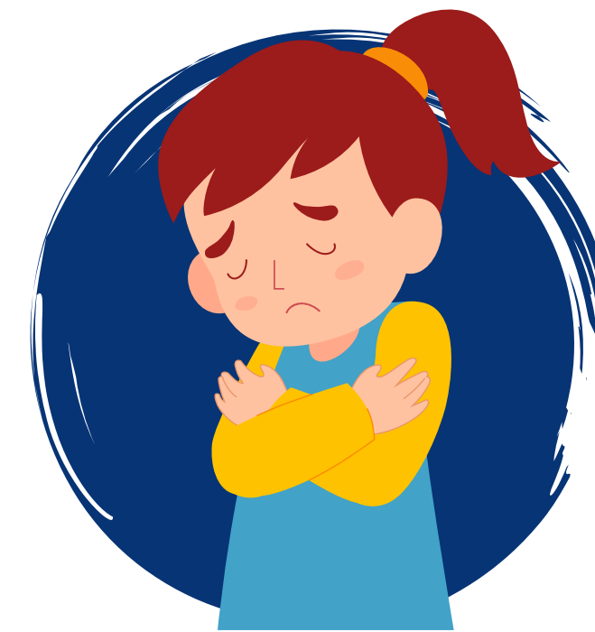
Angustiado debido a los síntomas