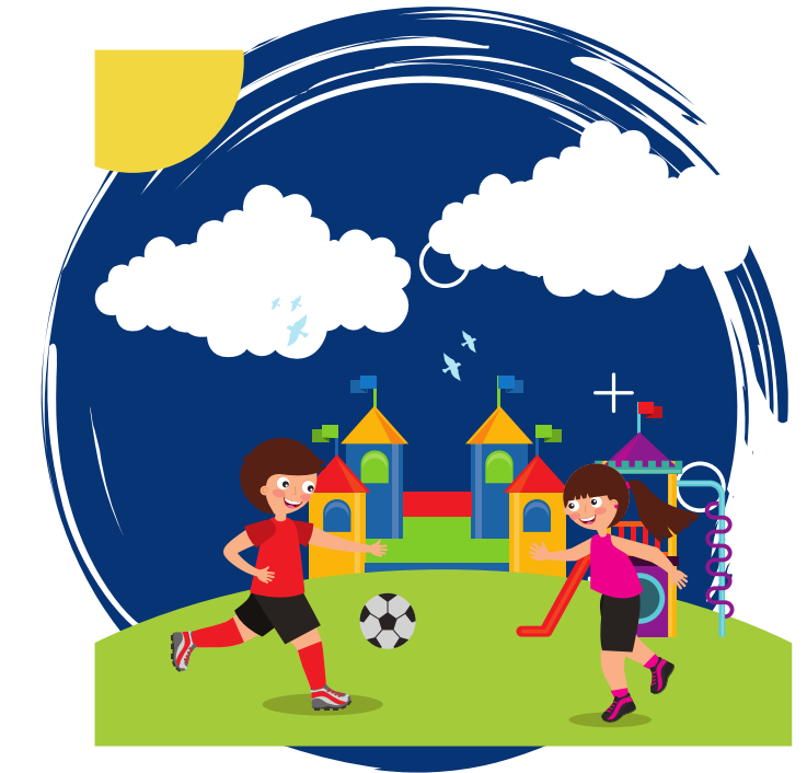
Perdida de interés o motivación para participar en deportes, juegos con otros niños y otras actividades