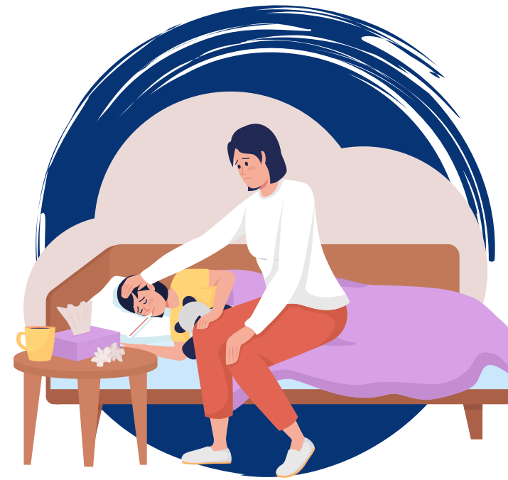
Ausencias más frecuentes a la escuela o a la guardería