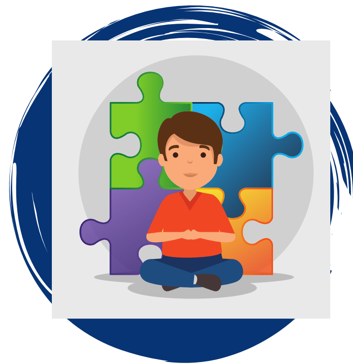
Retos en la salud mental