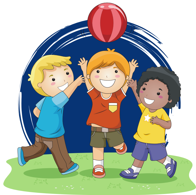
Limitación en las actividades físicas